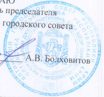
ГРАФИК приема граждан по личным вопросам руководством Ялтинского городского совета Республики Крым на ОКТЯБРЬ месяц 2018 года

В соответствии с Федеральным законом от 02.05.2006 № 59-ФЗ «О порядке рассмотрения обращений граждан Российской Федерации» и Положением об организации личного приема граждан в Ялтинском городском совете Республики Крым, утвержденным постановлением председателя Ялтинского городского совета от 26.12.2014 № 8, производится запись на личный прием граждан руководством Ялтинского городского совета Республики Крым в кабинете № 141/4 с 10-00 до 17-00 с понедельника по четверг по адресу: пл. Советская, 1, г. Ялта.